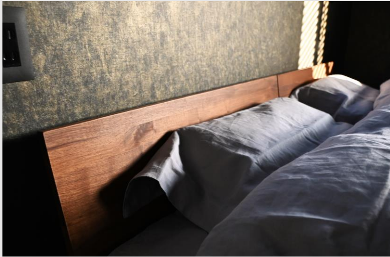
総無垢材オイル仕上げの【SOLID BED】。躍動感と迫力を感じさせる木目の風合い