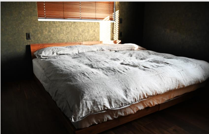
寝装品はコットン100%。視覚的にも触感的にも心地良く、敢えて「ゆるい感じ」に仕上げた拘りの寝装品