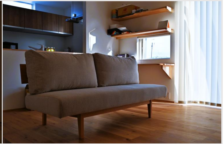
ご主人が座り心地を一番に気に入ったという【Brick Sofa】をリビングシーンの中心に