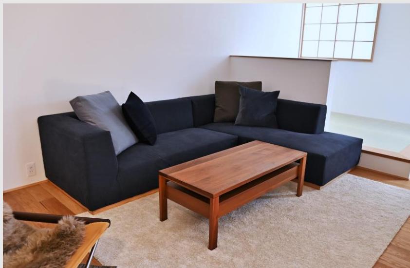
ご家族がゆったり寛げるリビングシーン

A. 元々、ミヤモト家具さんの存在は、いろいろな方から聞いて知っていました。そこで、今回の新築をキッカケに、まずSOLID富山に伺い、中村さんに対応頂いたのが始まりです。