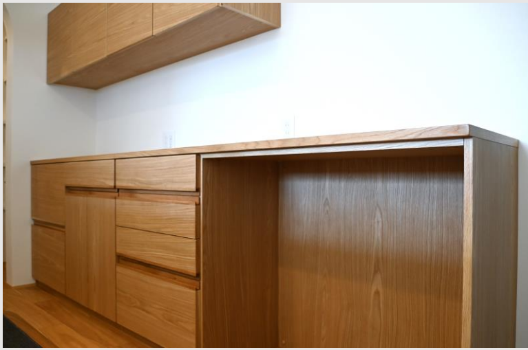
ゴミ箱収納+引き出し+扉と、機能性の部分は勿論、 躍動感あふれる木目の風合いと経年変化が同時に楽しめる