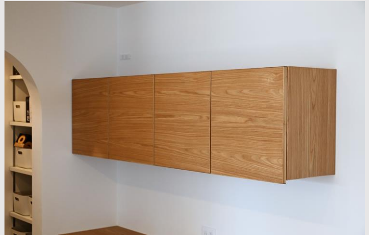
吊り戸棚は同じく、弊社で定番のAF Kitchen Hanging Door 天然木ならではの風合い。美しい木目通し。