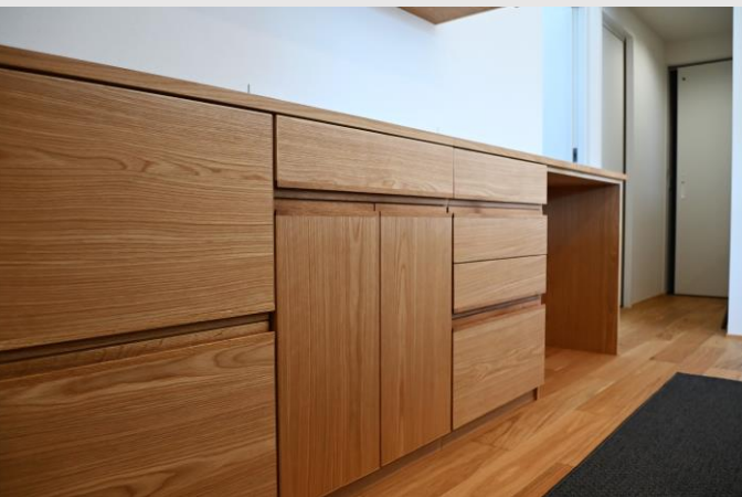
オーク無垢材+通常の突板の2.5倍の厚みを誇る、 厚突板を使用した、圧巻の仕上がり